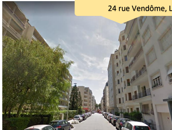
24 rue Vendôme, Lyon 6 ème

849 000 euros TTC FAI - honoraires charge vendeur